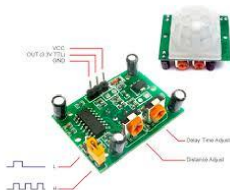
Рисунок 5.1 – Зовнішній вигляд датчика руху (присутності) HC-SR501

Датчик руху (англ. Motion sensor) - безконтактний датчик, що фіксує переміщення об'єктів і використовується для контролю за навколишнім оточенням або автоматичного запуску необхідних дій у відповідь на переміщення об'єктів.