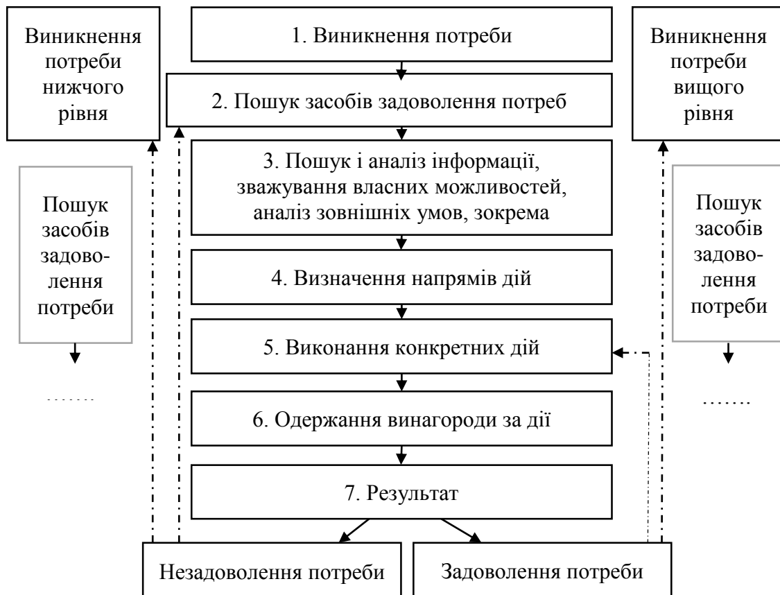
Рис. 3. Модель мотиваційного процесу

Методи мотиваційного управління, залежно від орієнтації на вплив на ті чи інші потреби, поділяються на: