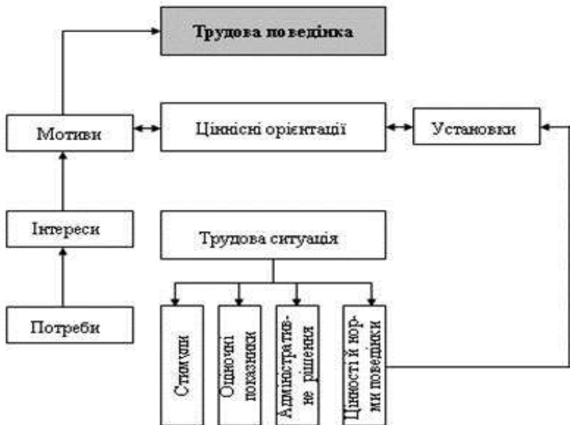
Рис. 1. Механізм регуляції трудової поведінки

Спільна діяльність людей в організації регулюється на трьох рівнях взаємодії: