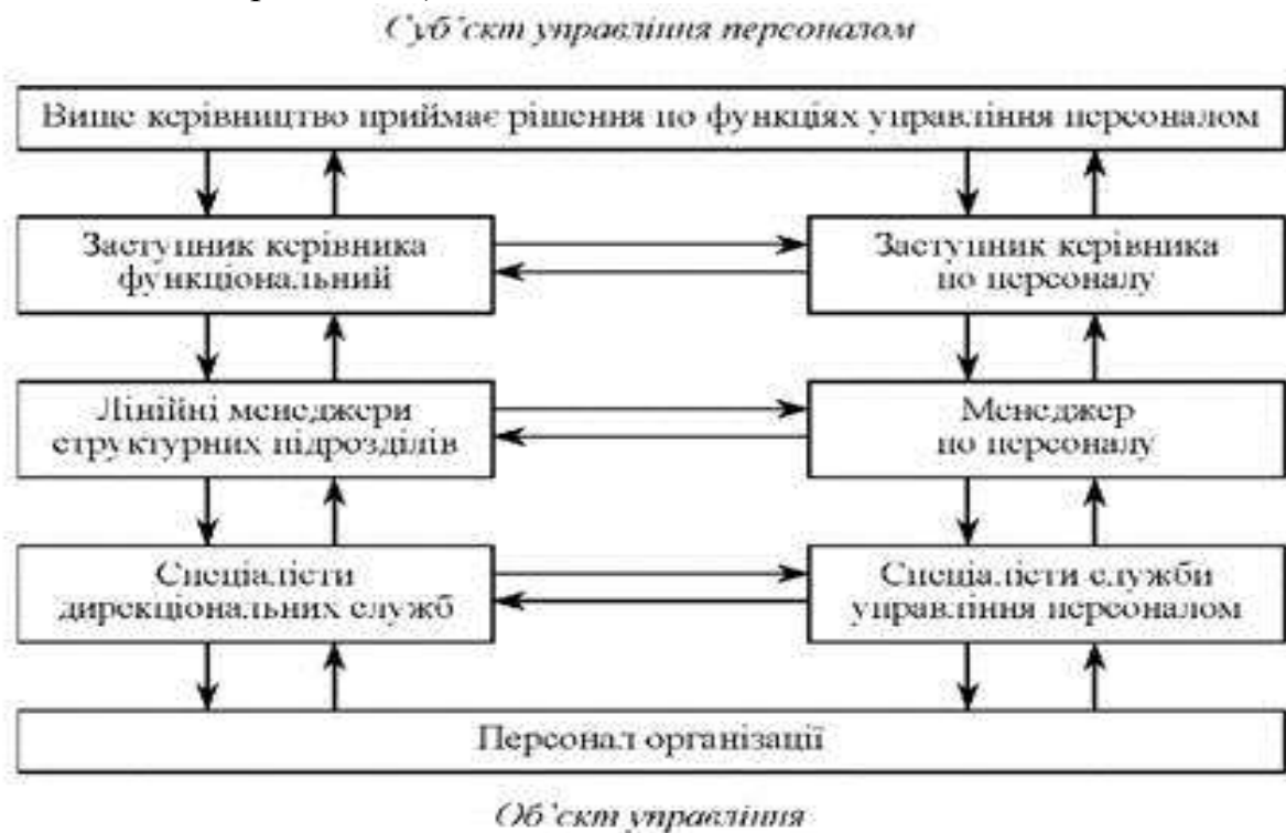
Рис. 3. Взаємозв'язки суб'єктів і об'єктів управління персоналом організації

В управлінні трудовим колективом людина (персонал) одночасно може бути суб'єктом управління (коли приймає рішення) і об'єктом управління (коли виконує рішення вищого керівництва).