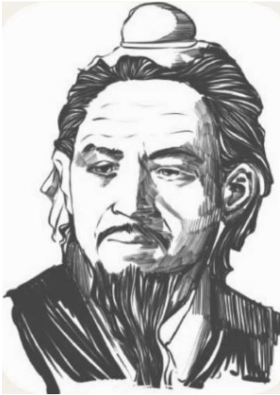
Китайський стратег і мислитель Сунь-Цзи (544-496 до н.е.)

Автор знаменитого трактату про військову стратегію “Мистецтво війни”. Хоча його роботи не містять прямих настанов про сучасну мобілізацію, в них можна знайти концепції, що можуть бути застосовані до цього поняття. Ось кілька ключових ідей, які можна пов'язати з мобілізацією: