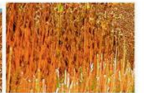
стебла соняшника (первинні залишки)