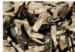
лушпиння соняшника (вторинні відходи)