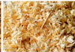
вторинні деревні залишки (тирса)