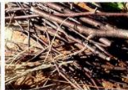
первинні деревні залишки (гілки)