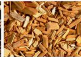
вторинні деревні залишки (тріска)