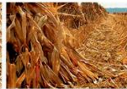
стебла кукурудзи (первинні залишки)