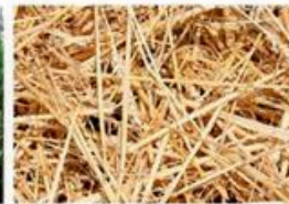
соллома (первинні залишки)