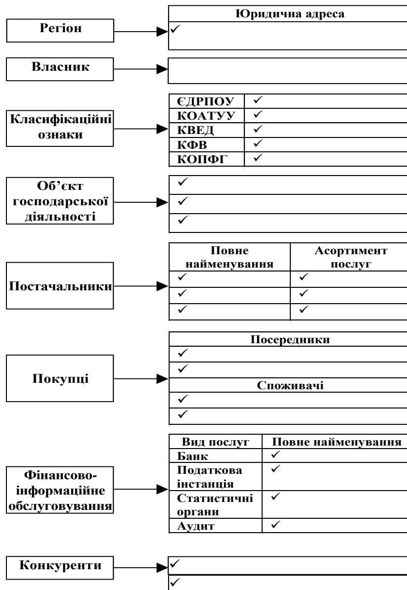
Рис. 4.1. Підприємство та його економічне оточення