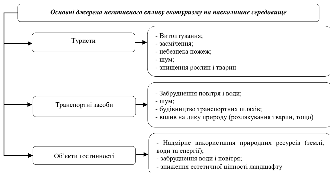
Рис. 1. Особливості екотуризму в Україні