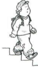
Otto geht runter. (herunter/hinunter)