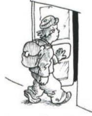
Otto geht rein. (herein/hinein)