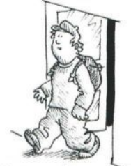
Otto geht raus. (heraus/hinaus)