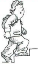
Otto geht rauf. (herauf/hinauf)