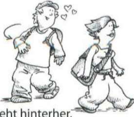
Otto geht hinterher.