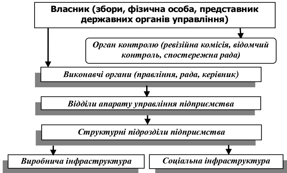
Рис. 1. Загальна схема управління суб'єктом господарювання