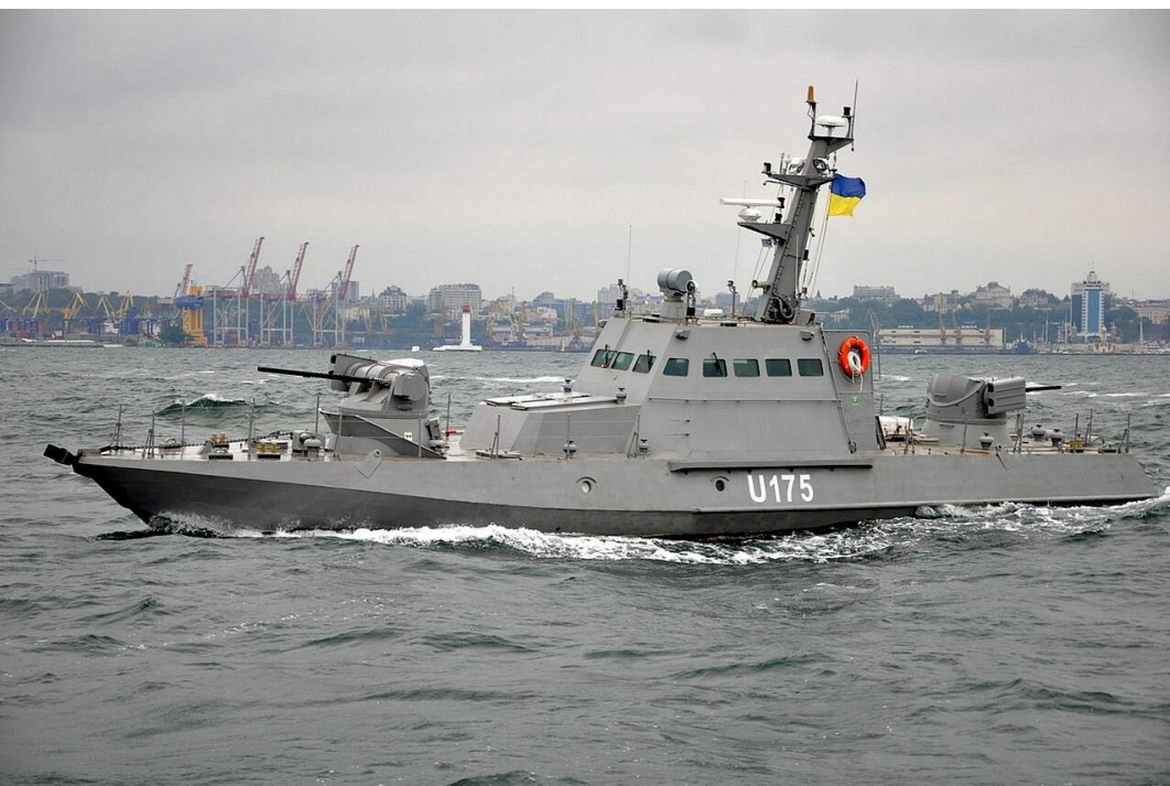
малий бронекатер проєкту 58155

Виготовлено перших два десантно-штурмових катери проєкту 58503 (“Кентавр-ЛК”).