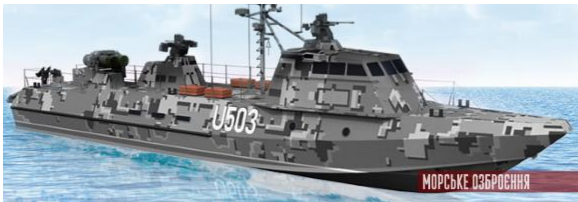
десантно-штурмовий катер проєкту 58503

В грудні 2016 р. український флот отримав перше за десять років поповнення – два малих бронекатери проєкту 58155 (“Гюрза-М”) “Бердянськ” і “Аккерман”.