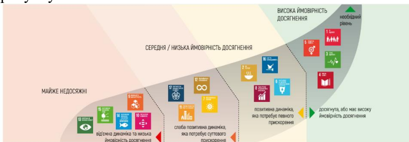
Рис. 1. Ранжування цілей за інтегральною оцінкою прогресу у досягненні ЦСР, у розрізі кожної цілі за відповідними показниками

4. Відповідно до звіту 2020 р. стан та динаміка досягнення Цілей сталого розвитку Україною зображена на рисунку.