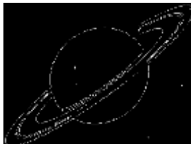
КОНТУРИ НА ПОЧАТК. ЗОБР.