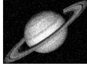
ЗОБРАЖЕННЯ З ШУМОМ