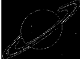
КОНТУРИ НА ПОЧАТК. ЗОБР.