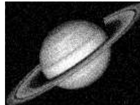
ЗОБРАЖЕННЯ З ШУМОМ