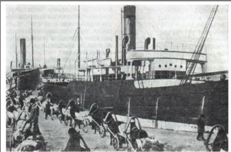
Погрузка хліба на пароплав.

1817 р. - Одеса оголошена відкритим, вільним портом (порто-франко).