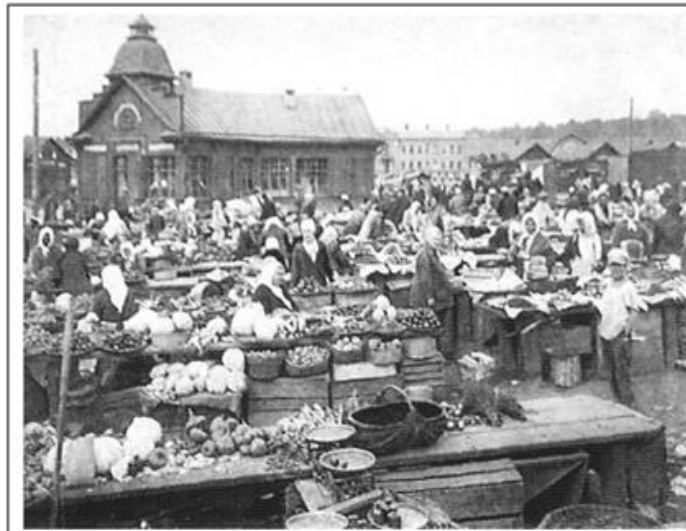
Харків. Базар. Поч. XX ст.