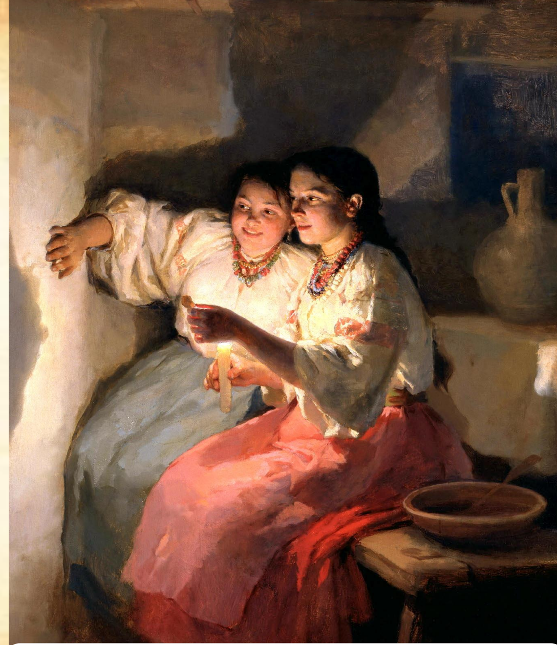
Картина «Святочне Ворожіння». 1888. М. Пимоненко.