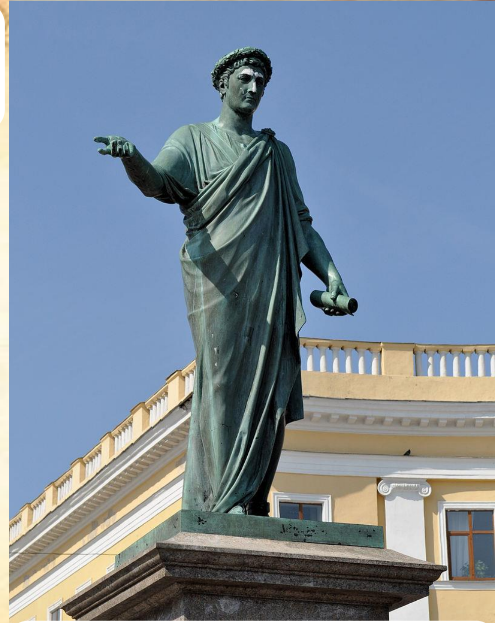
Пам'ятник градоначальнику та генерал-губернатору А. де Рішельє в Одесі. Скульптор І. Мартос. 1828.