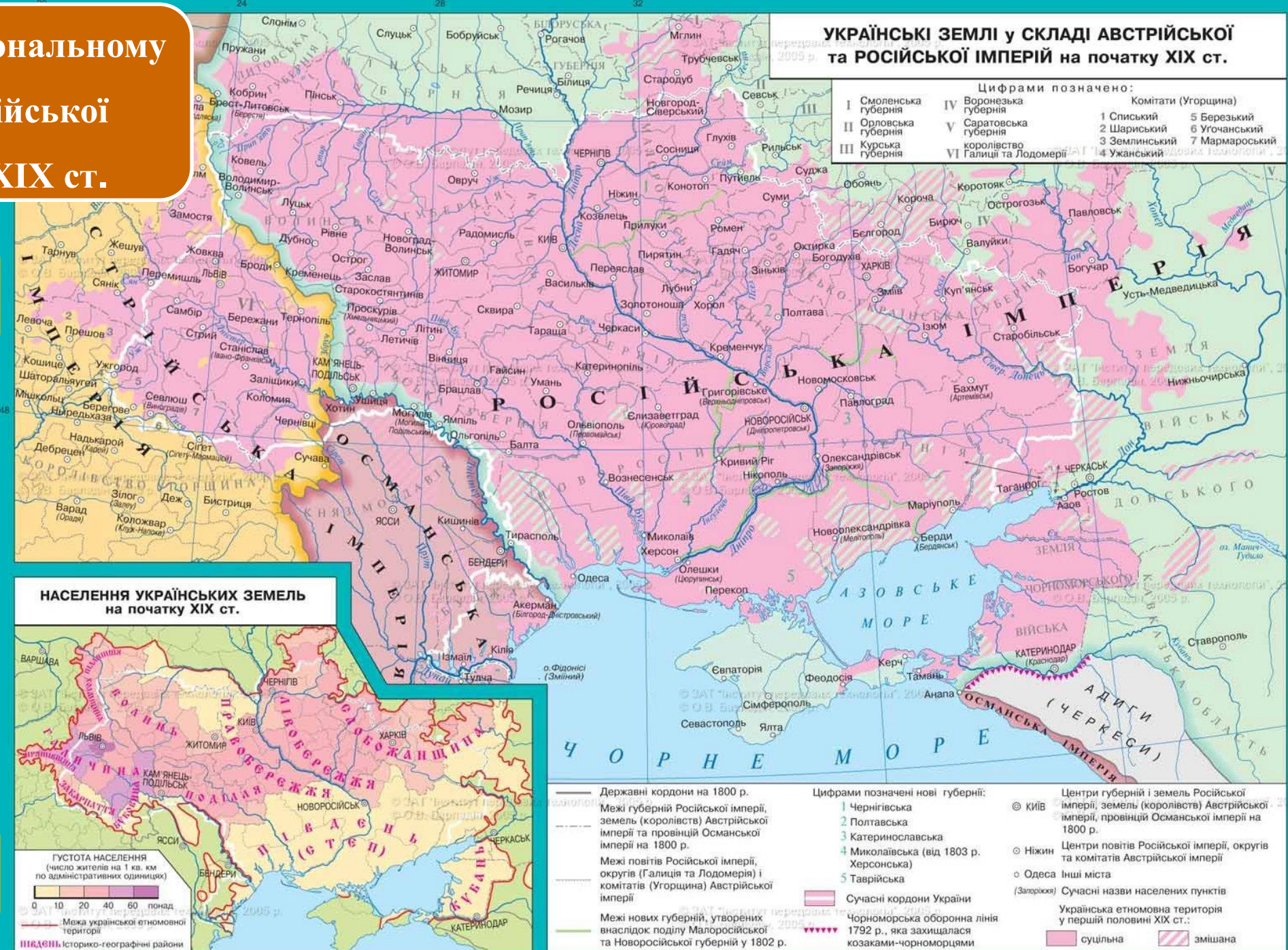
НАСЕЛЕННЯ УКРАЇНСЬКИХ ЗЕМЕЛЬ на початку XIX ст.