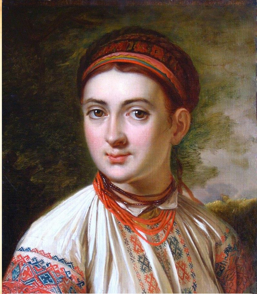
«Дівчина з Поділля» В. Тропінін