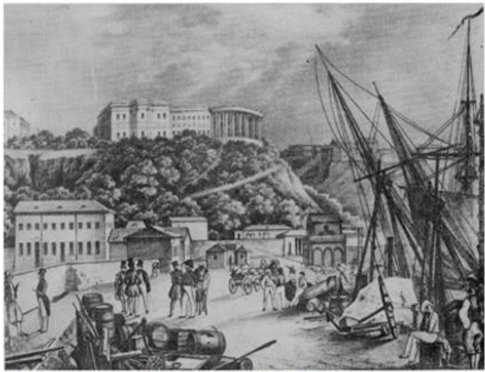
Одеса. «порто – франко» Поч. XIX ст. Літографія Ф. Гроса

Розвиток промислових підприємств у містах сприяв зростанню чисельності міського населення.