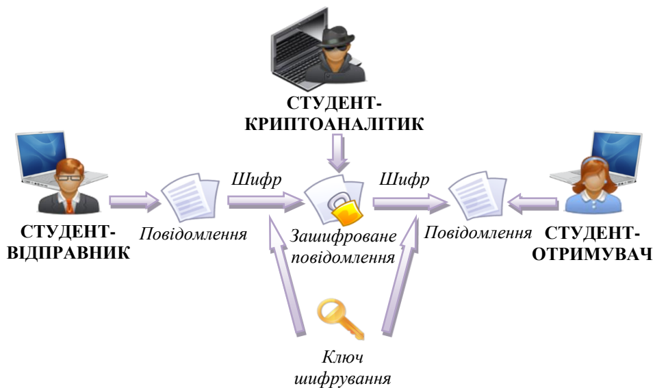
Рис. 1.5. Схема обміну повідомленнями між студентами

Студентам потрібно поділитися на ротаційні групи з трьох чоловік: СТУДЕНТ-ВІДПРАВНИК , СТУДЕНТ-ОТРИМУВАЧ , СТУДЕНТ-КРИПТОАНАЛІТИК . Обмін повідомленнями між учасниками відбуватиметься за схемою (рис. 1.5), в основі якої лежить секретна система зв'язку, описана Клодом Шеноном.