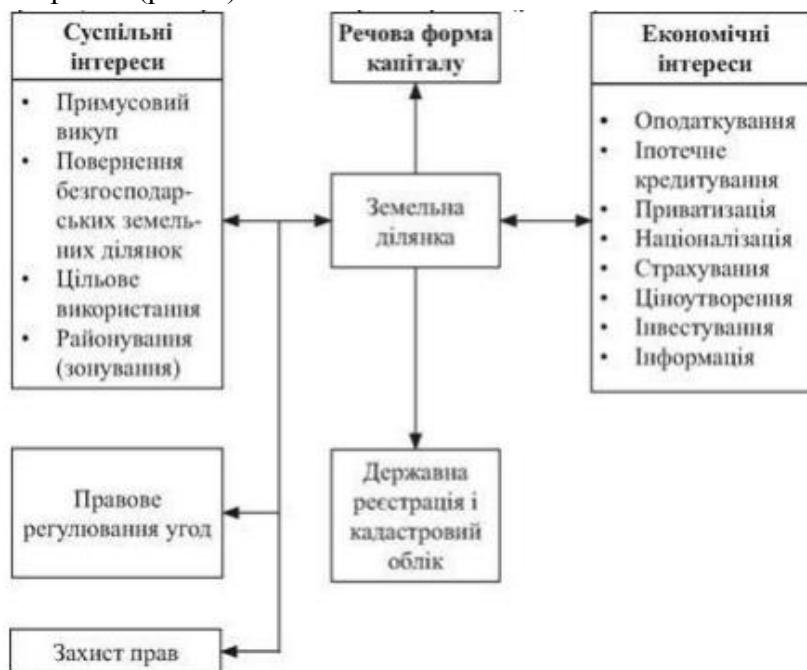
Рис. 3. Земельна ділянка як об'єкт економічних і державних інтересів

переплетіння різних економічних процесів, приватних і суспільних інтересів, адміністративних норм і правил (рис. 3).