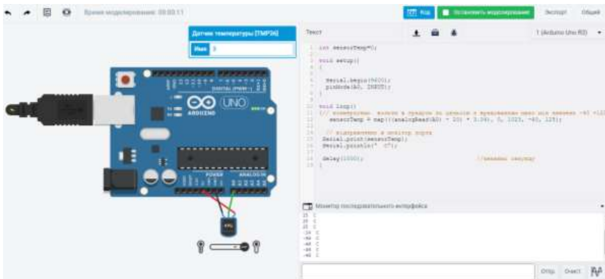
Рисунок 6.4 – Результат роботи моделювання макету в tinkercad

Результат роботи програми з симуляцією датчика температури TMP36 представлений на рис.6.4.