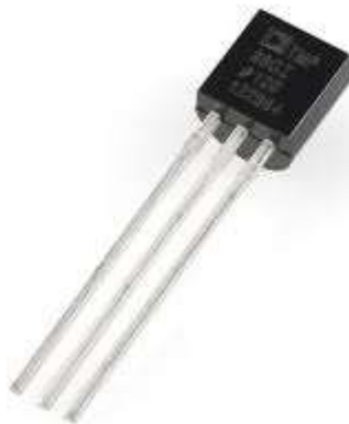
Рисунок 6.1 – Зовнішній вигляд датчика температури

Ці датчики використовують технології твердотільної електроніки для визначення температури. Тобто, в них немає ртуті (як в старих термометрах) або біметалевих пластин. Замість в них встановлені термістори (чутливі до температур резистори). У термісторах при підвищенні температури, підвищується напруга в діоді (технічно це різниця напруги між базою і емітером в транзисторі). Точне зняття показань напруги дає можливість генерувати аналоговий сигнал, пропорційний температурі. Звичайно, технологія не настільки лінійна, але по суті саме так і міряється температура.