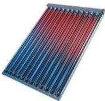
Рис. 2.2 – Вакуумний трубчастий колектор

Абсорбер закритий згори світлопрозорим обгороджуванням (один або два шари скла або прозорого, стійкого від впливу ультрафіолету пластика). Панель є теплообмінником, по каналах якого прокачується вода, що нагрівається. Вода прямує в тепло ізований бак, гідравлічно-сполучений з сонячним колектором.