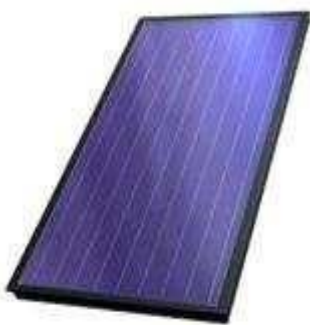
Рис. 2.1 – Плоский сонячний колектор

Існує безліч різних сонячних колекторів, призначених для нагрівання води. Все різноманіття сонячних колекторів можна розділити на наступні типи: плоскі сонячні колектори і вакуумні трубчасті колектори.