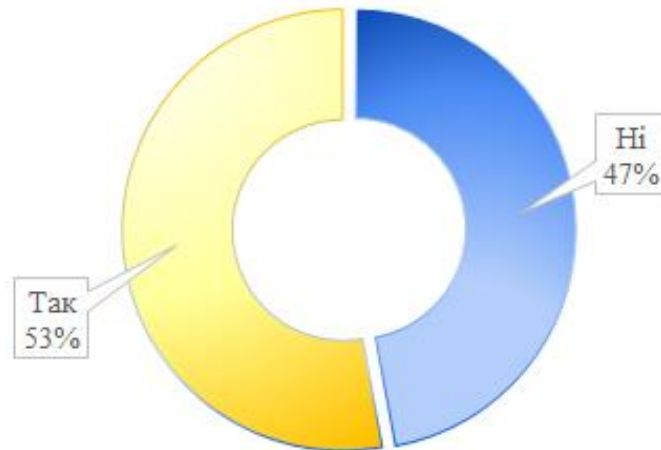
Рис. 3.2. Розподіл респондентів відповідно до критерію схильності до прийняття спонтанних рішень щодо себе й оточуючих

емпіричних даних. Відповідно до форми побудови розрізняють діаграми площинні, лінійні, об'ємні тощо. Приклад подання площинної секторної діаграми у кваліфікаційній дипломній роботі наведено на рис. 3.2.