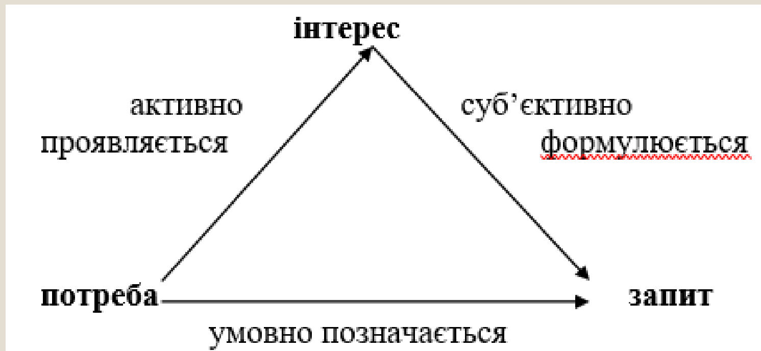
Рисунок 2 - Співвідношення між інформаційними потребою, інтересом та запитом