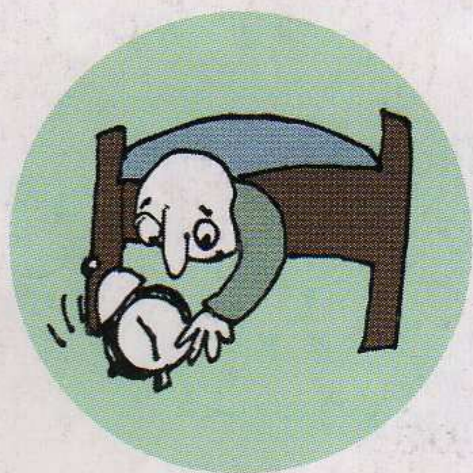
budzić się, -ę, -isz

jeść, -m, -sz śniadanie pić, piję, pijesz kawę iść, idę, idziesz do pracy pracować, -ę, -esz jeść obiad robić, -ę, -isz zakupy wracać, -m, -sz do domu oglądać, -m, -sz telewizję czytać, -m, -sz książkę iść na spacer iść spać spotykać, -m, -sz się z kolegą rozmawiać, -m, -sz przez telefon spać, śpię, -isz