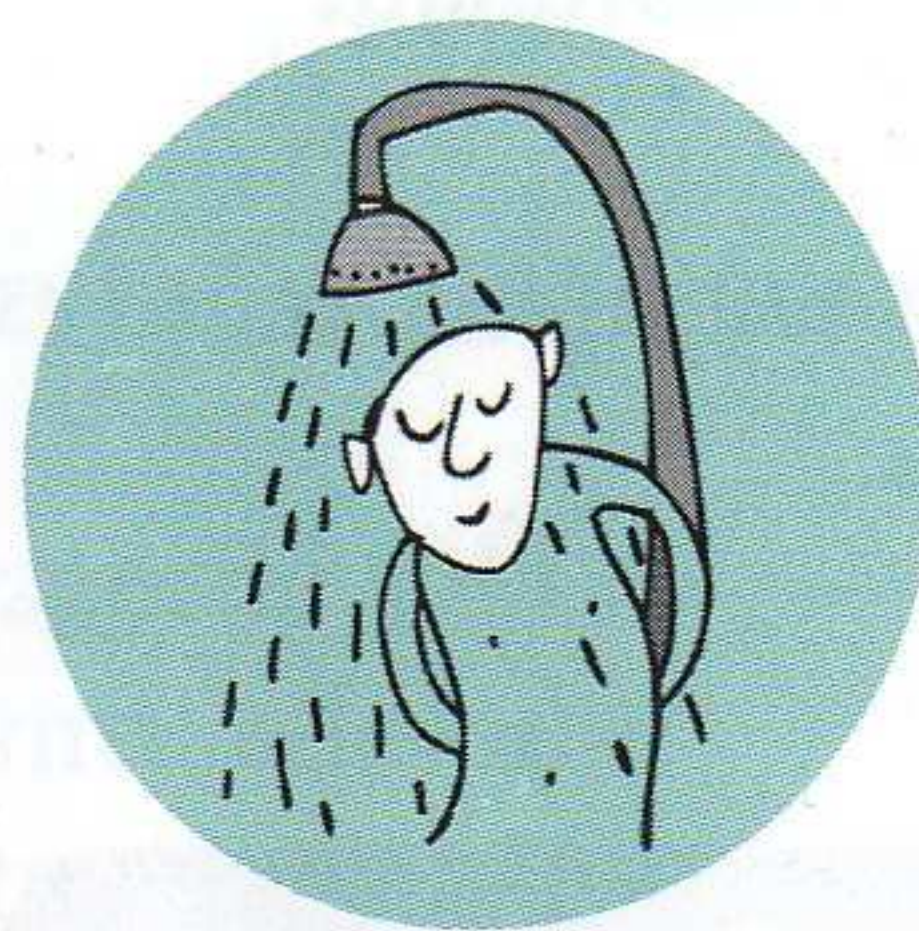
brać prysznic, biorę, bierzesz