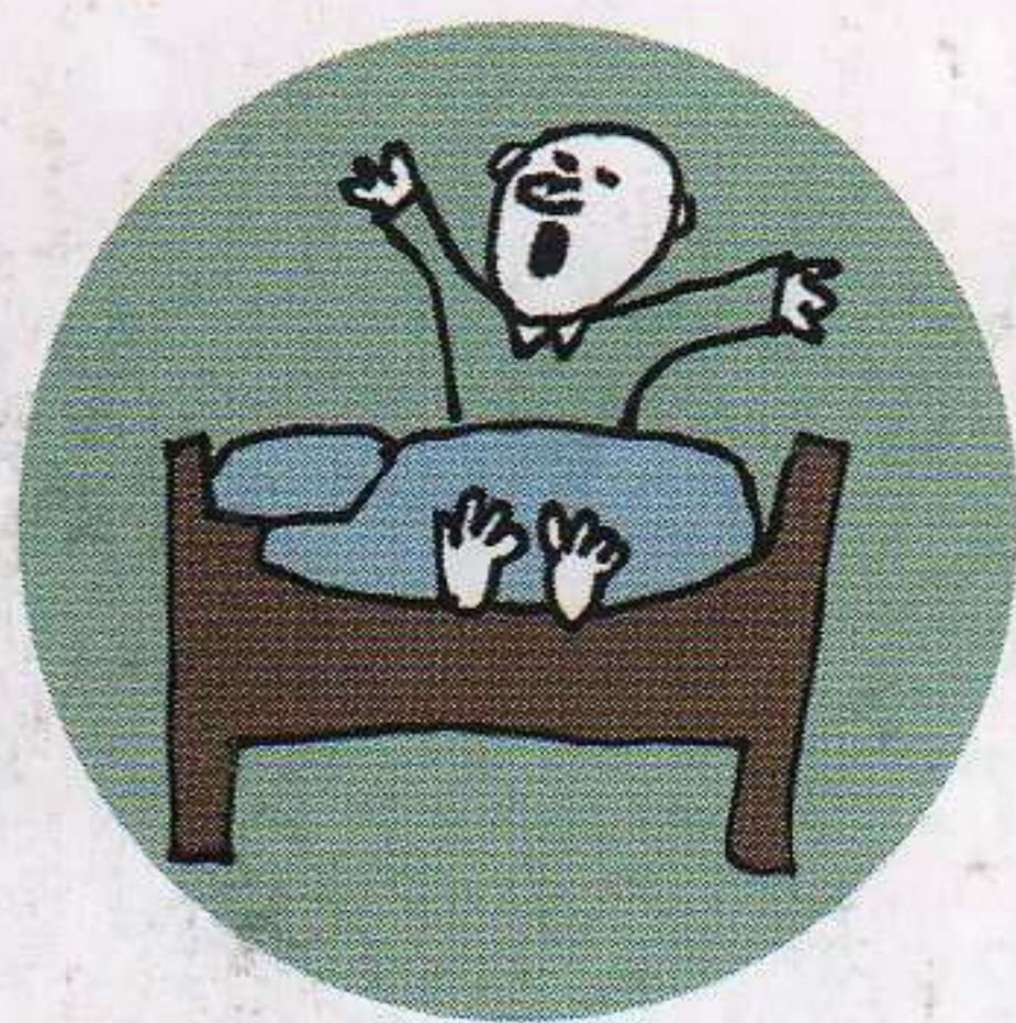
wstawać, wstaję, wstajesz