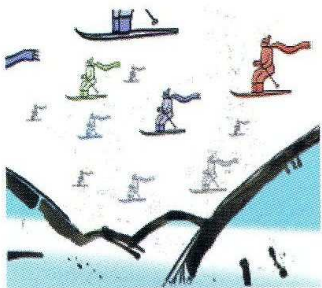
jeździć na nartach