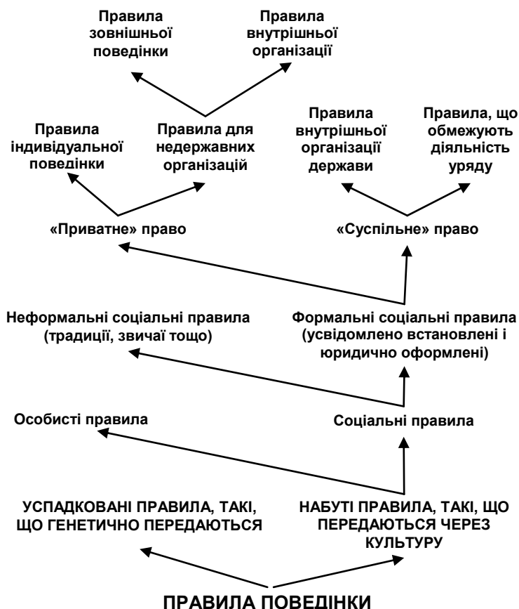
Рис. 2. Класифікація правил поведінки 2 (за В. Ванбергом)