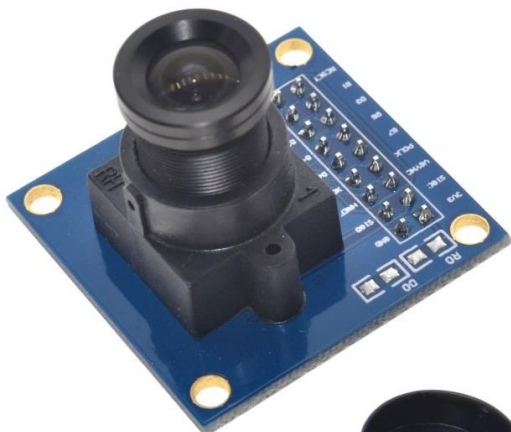
Рисунок 5.1 – Зовнішній вигляд відеокамери OV7670

OV7670 є модуль камери з буфером типу FIFO. В даний час він виробляється кількома фірмами і доступний з різним розпинанням. OV7670 забезпечує повномасштабне (full frame) 8-бітове зображення у вікні. OV7670 вміє працювати з різними форматами відео. У роздільній здатності VGA камера забезпечує до 30 кадрів в секунду. Зовнішній вигляд модуля камери OV7670 показано на рис.5.1.