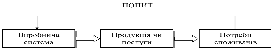
Рис. 1.2. Ланцюжок „Виробництво – Потреби споживача”

Основне призначення фірми характеризується ланцюжком «ВИРОБНИЦТВО – ПОТРЕБИ СПОЖИВАЧА», який можна представити у вигляді деякої схеми (рис. 1.2).