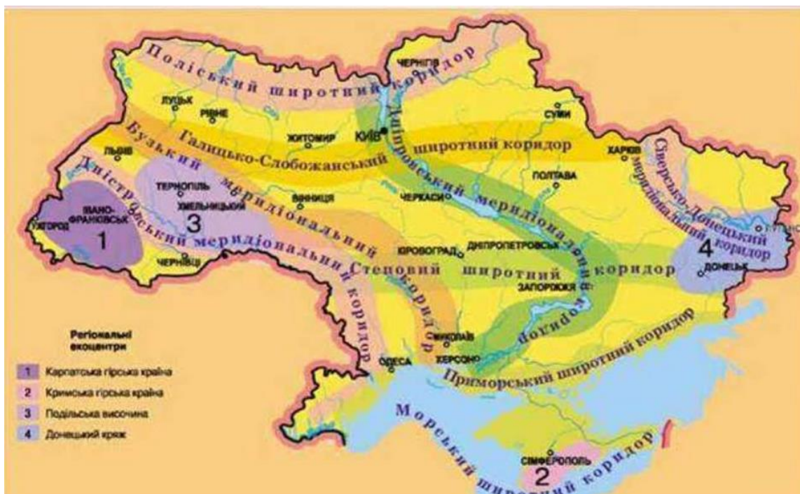
Рис. 6.2 Екологічна мережа

Завдання 6.1. Здобувачі вищої освіти на основі теоретичного матеріалу мають скласти кросворд (по 10 питань по горизонталі та вертикалі).