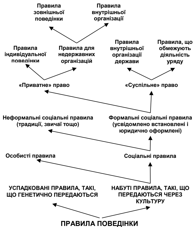
Рис. 1. Класифікація правил поведінки 1 (за В. Ванбергом)