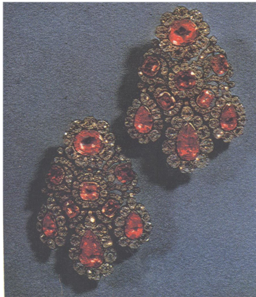
Підвіски. 1764р. Ювелір Пфістер. Діаманти, шпінелі, срібло.