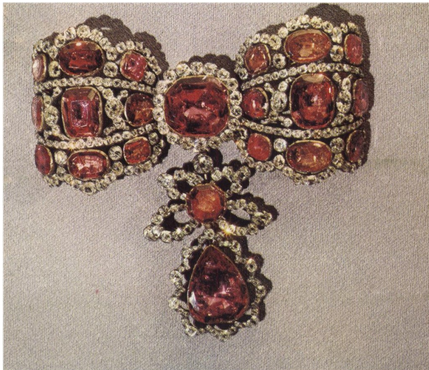
Бант-склаваж. 1764р. Ювелір Пфістер. Діаманти, шпінелі, золото, срібло.