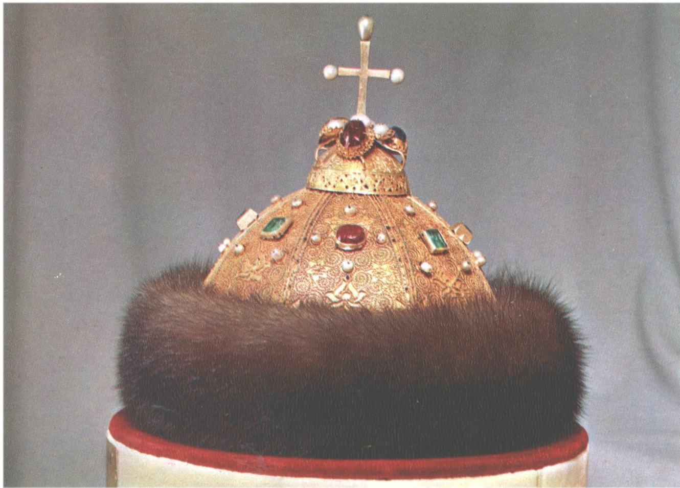
Шапка Мономаха. XIII-XIV ст. Золото, коштовні камені, перлини, соболь. Скань.