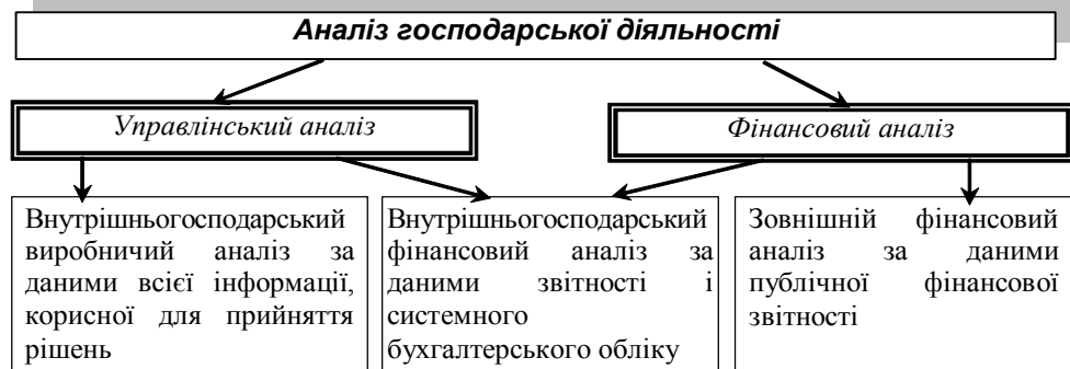
Рис. 2.2. Основні функції економічного аналізу 12

⇒ Санкт-Петербурзької школи аналітиків під керівництвом проф. В.В. Ковальова: аналіз фінансово-господарської діяльності ділиться на два види: фінансовий і внутрішньофірмовий. Логіка розподілу базується на тому, що інформаційні ресурси підприємства, яке потенційно має аналізуватися, ділиться на загальнодоступний та обмеженого користування 13 .