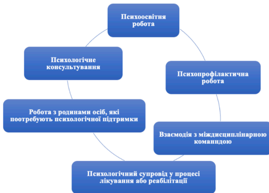
Рис.1.1. Основні напрями роботи психолога у сфері клінічної та реабілітаційної психології

...основні напрями роботи психолога у сфері клінічної та реабілітаційної психології можна узагальнити у вигляді схеми, поданої на рис. 1.1.