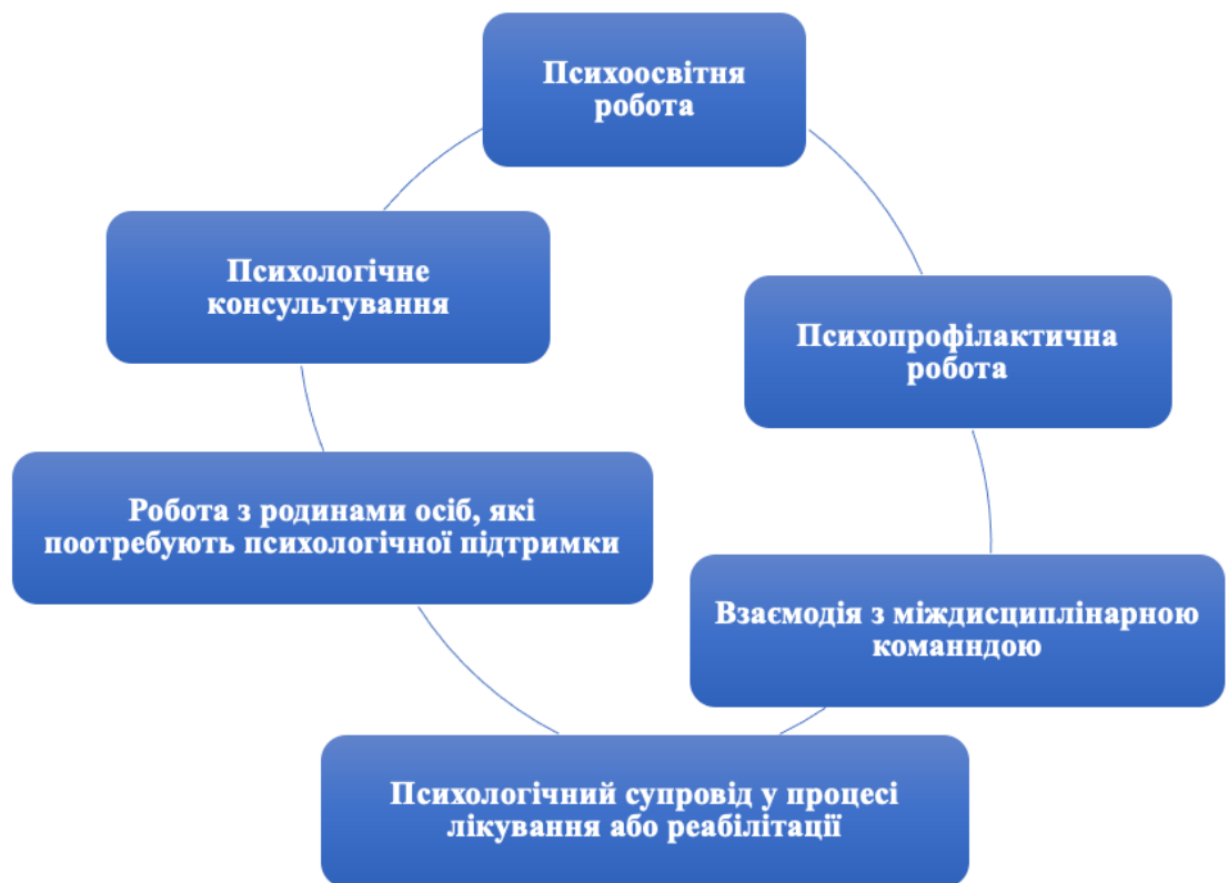
Рис. 1.1. Основні напрями роботи психолога у сфері клінічної та реабілітаційної психології

...основні напрями роботи психолога у сфері клінічної та реабілітаційної психології можна узагальнити у вигляді схеми, поданої на рис. 1.1.