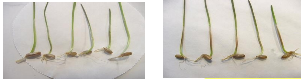
Рис. 2. Проросле насіння: наявність або відсутність антоціанової пігментації в колеоптилі жита посівного ( Secale cereale L.) .

Для деяких видів визначають рівень плоїдності сортів (наприклад, диплоїдні і тетраплоїдні сорти пажитниці багаторічної ( Lolium perenne L.)), проводять тести на визначення вмісту ерукової кислоти та глюкозинолатів (наприклад, ріпаку ( Brassica napus L. oleifera )), наявність антоціанової пігментації на колеоптилі жита посівного ( Secale cereale L.), реакцію насіння на фенол пшениці м'якої ( Triticum aestivum L.) (Рис. 2,3).