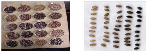
Рис. 3. Зернівка в фенолі.

У сортовій сертифікації для вирішення спірних питань успішно застосовують біохімічні методи ідентифікації (електрофорез запасних білків і ферментів, полімеразна ланцюгова реакція). Однак використання електрофорезу є витратним для встановлення сортової чистоти. Електрофорез може також використовуватись для підтвердження ідентичності окремих партій насіння, якщо на основі морфологічного опису не вдалося зробити кінцевий висновок. Застосувавши електрофорез у випадку гібридів соняшнику однорічного ( Helianthus annuus L.), ріпаку ( Brassica napus L. oleifera ) або кукурудзи звичайної ( Zea mays L.), можна оцінити рівень гібридності, а також сортової чистоти гібридів. За наявності молекулярних маркерів для відповідних ботанічних таксонів може застосовуватися ПЛР-аналіз, як альтернативний метод ідентифікації.