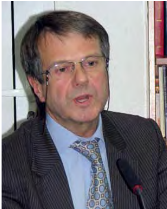
Віталій Мельничук, заступник голови Рахункової палати України в 1997–2005 роках

П ісля відновлення незалежності в 1991 році економіки України як єдиної цільності не існувало. Це була частина дуже специфічного, але єдиного господарського комплексу, зорієнтована на задоволення економічних, військових та інших потреб усього СРСР.