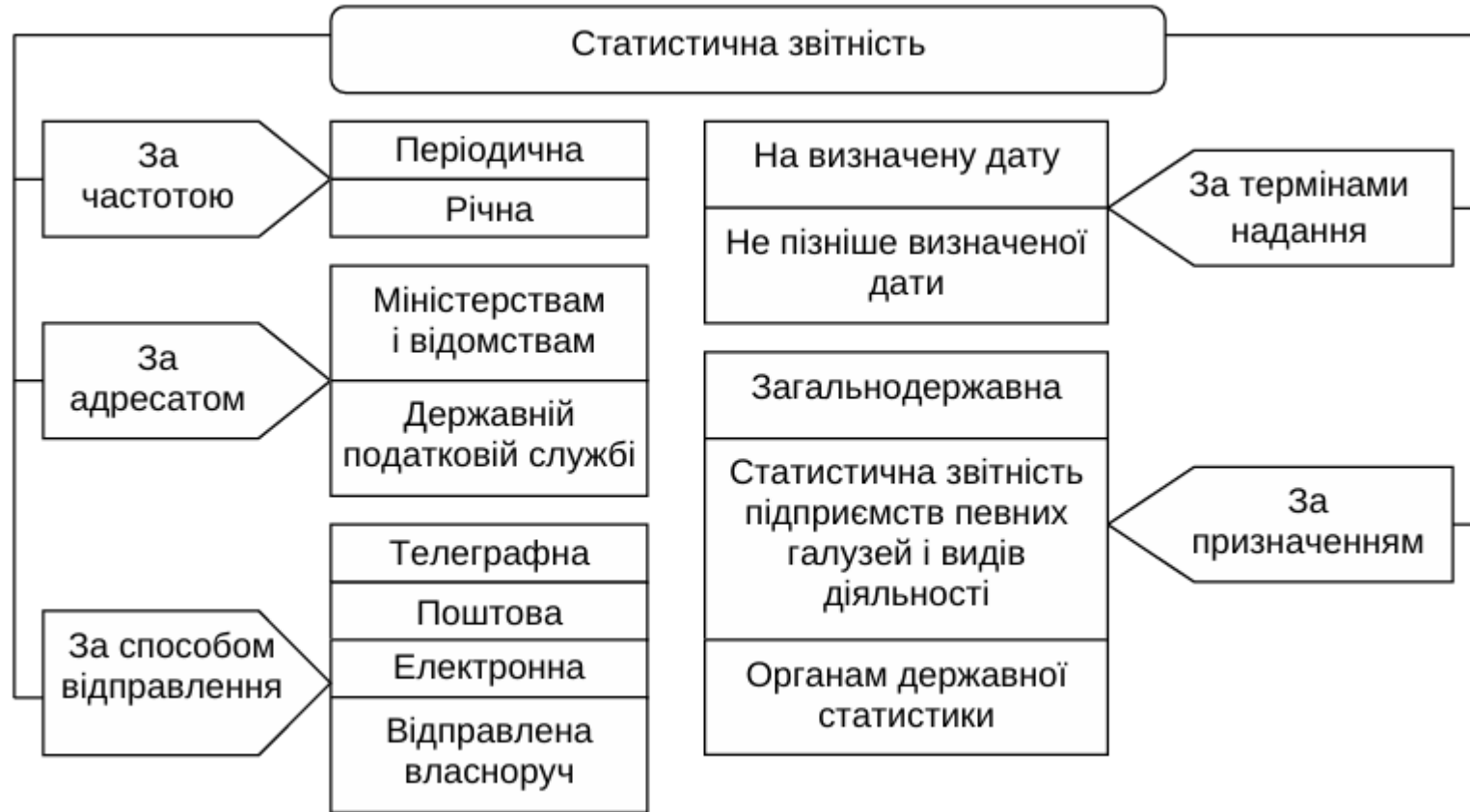
Рис. 3. Класифікація статистичної звітності

Отже, статистичну звітність можна класифікувати за наступними ознаками (рис. 3).