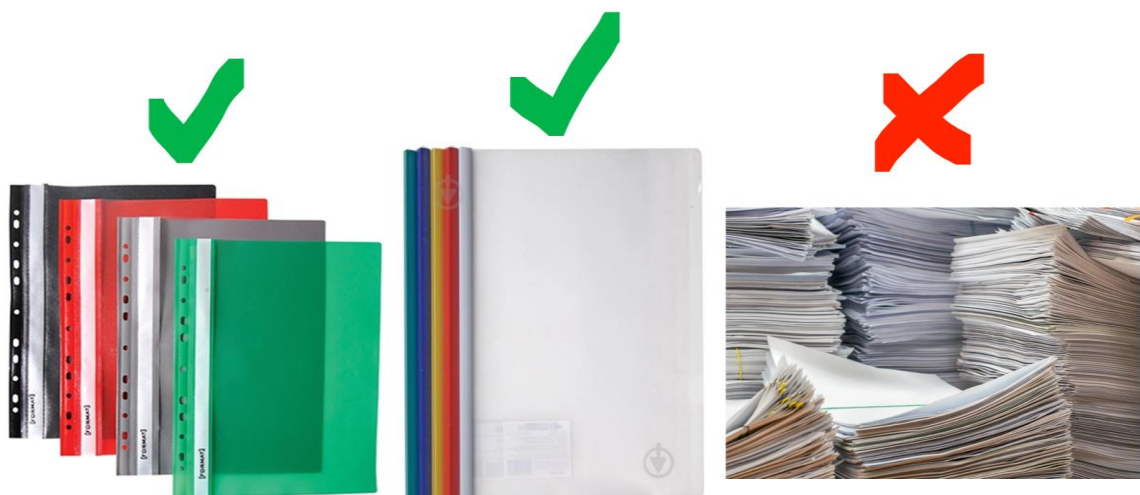
Рис. 2. Рекомендована форма здачі паперового звіту

Паперовий звіт (рекомендуємо рис. 2) подається здобувачем вищої освіти на кафедру і підлягає рецензуванню керівником практики від університету. Оцінка за практику ставиться за результатами оформлення та захисту звіту. Здобувачі вищої освіти звітують про проходження практики перед комісією, визначеною наказом, до складу якої входять керівники практики від кафедри. Захист практики проводиться в усній формі. Враховується зміст звіту; якість описаної інформації; оформлення звіту згідно з вимогами; навички здобувача вищої освіти пов'язувати теоретичні знання з практикою господарювання. Оцінка за практику вноситься до відповідної відомості.