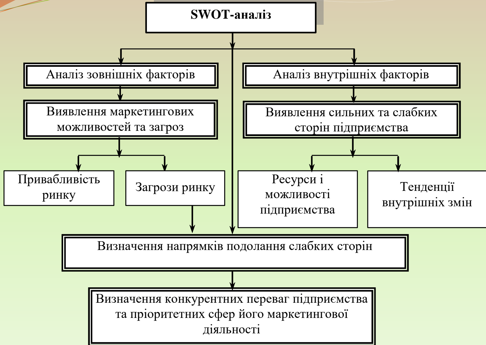
Рис. 1. Процес SWOT-аналізу