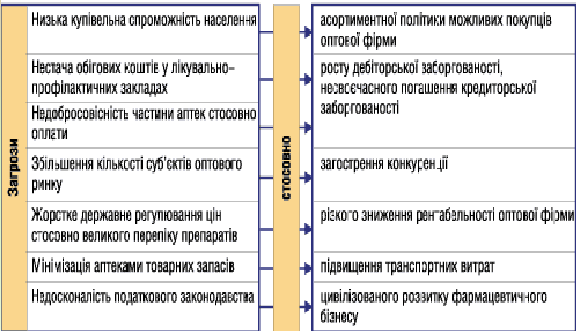
Рис. 7. Приклад розпізнавання загроз оптового фармацевтичного підприємства