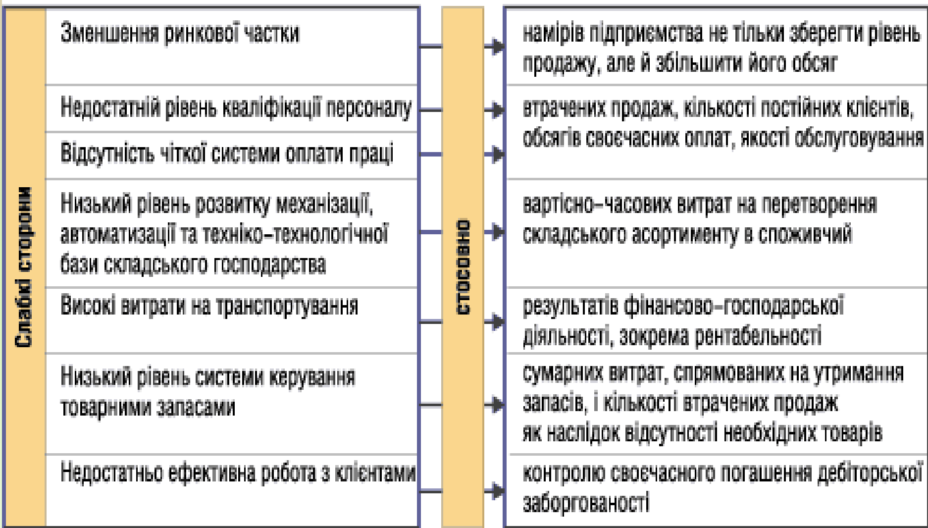
Рис. 5. Приклад розпізнавання слабких сторін оптового фармацевтичного підприємства