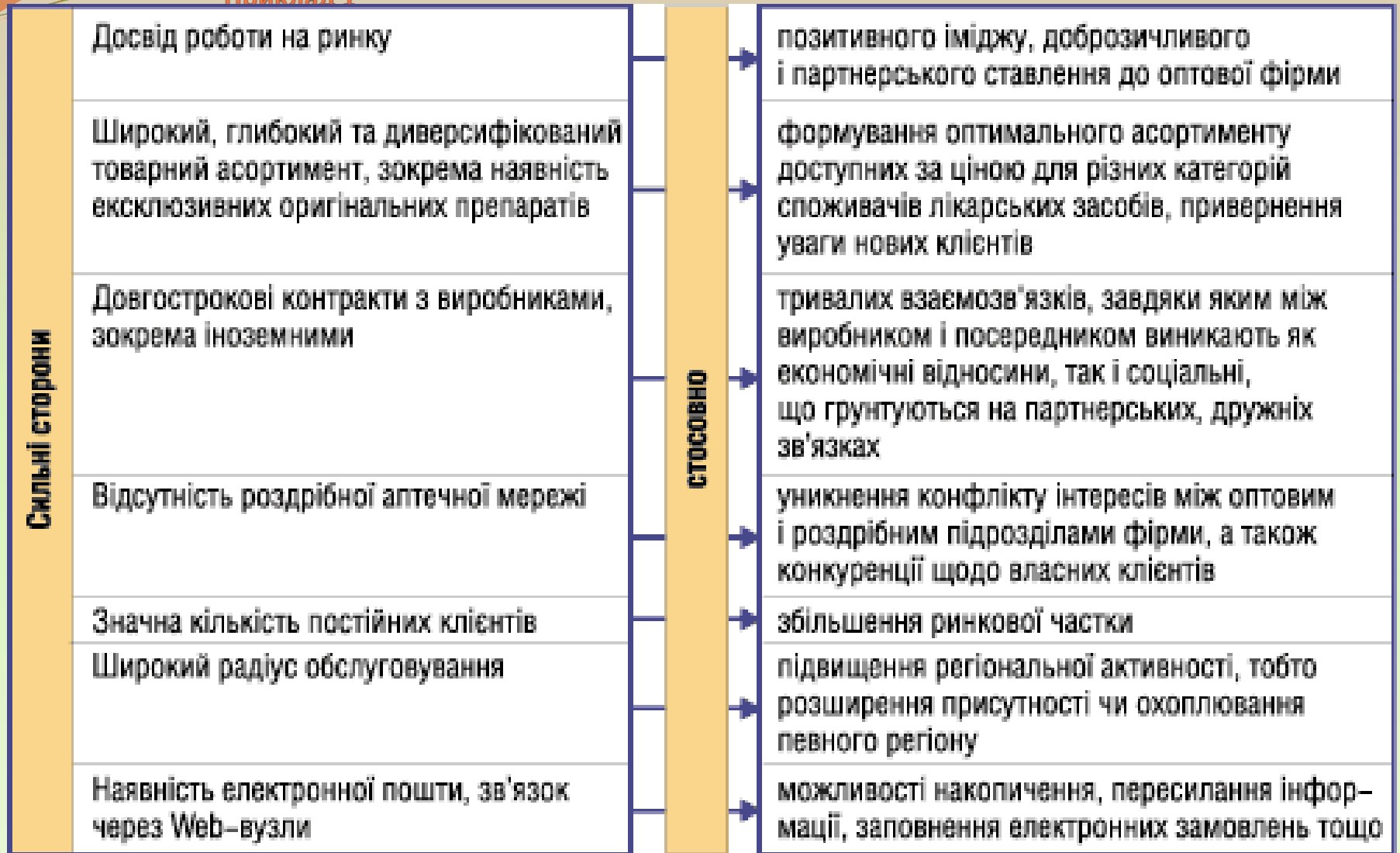
Рис.4. Приклад розпізнавання сильних сторін оптового фармацевтичного підприємства