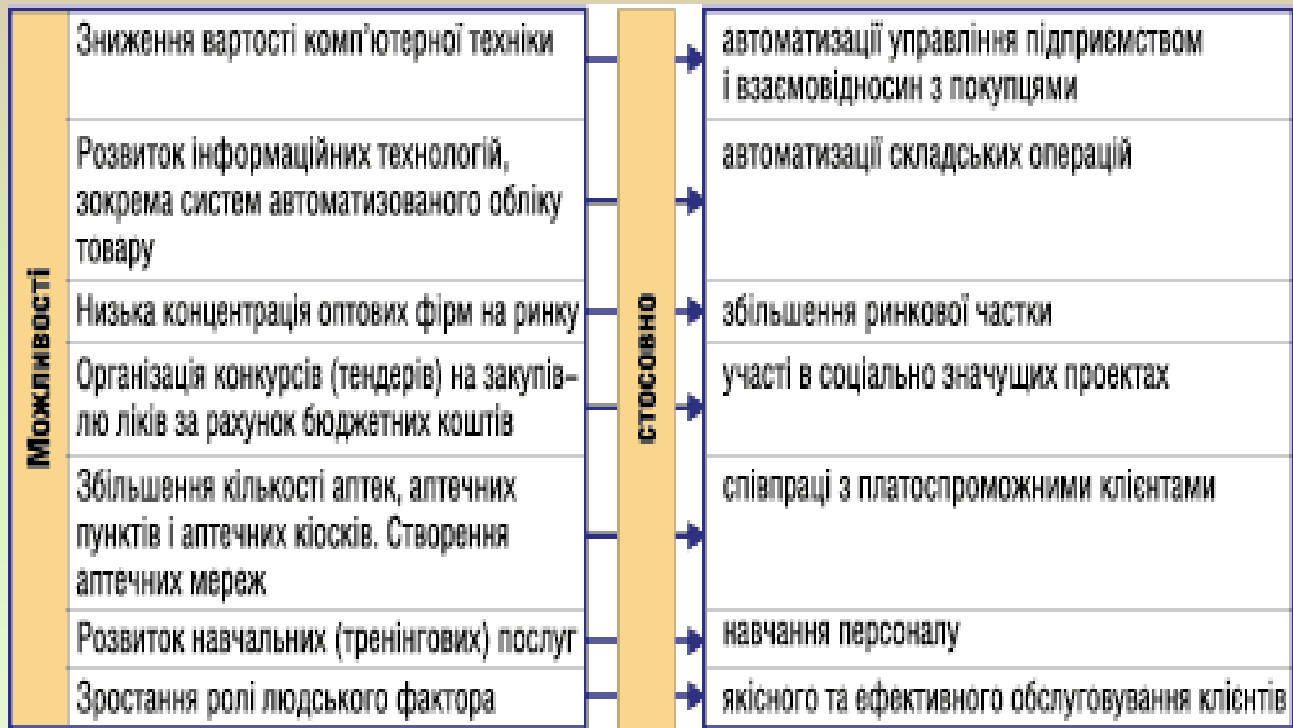
Рис. 6. Приклад розпізнавання можливостей оптового фармацевтичного підприємства