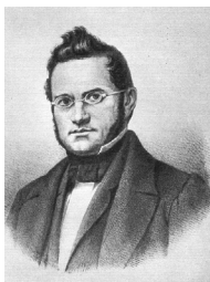
Президент Швейцарії Йонас Фуррер