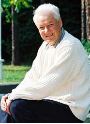
Президент Росії Борис Єльцин