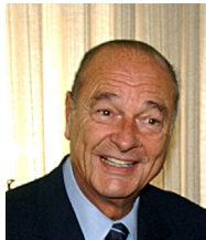
Президент Франції Жак Рене Ширак