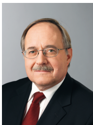
Президент Швейцарії Самуель Шмід