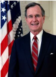
Президент США Джордж Буш