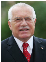
Прем'єр-міністр Чехії Вацлав Клаус