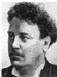
Президент Швейцарії Марк- Еміль Руше