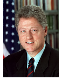
Президент США Білл Клінтон