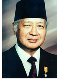
Президент Індонезії Сухарто