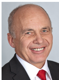
Президент Швейцарії Улі Маурер