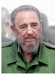
Кубинський команданте Фідель Кастро