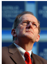
Президент Швейцарії Йозеф Дейс