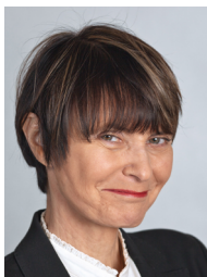
Президент Швейцарії Мішлін Кальмі-Рей