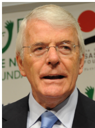
Прем'єр-міністр Великобританії Джон Мейджор