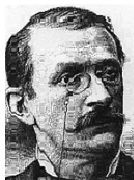
Президент Швейцарії Луї Рюшонне