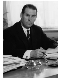
Федеральний канцлер ФРН Герхард Шрьодер