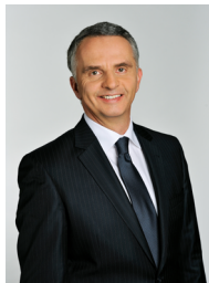
Президент Швейцарії Дідьє Буркхальтер