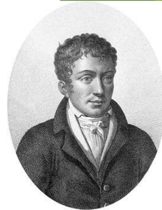
Кабаніс П'єр Жан Жорж (1757 — 1808)

Значний вплив на подальший розвиток психології здійснила і теорія П.Ж.Кабаніса (1757-1808), якою завершується цей етап у французькій науці. Кабаніс доповнив дослідження Ламетрі і Дідро про взаємозв'язок психіки і тілесної організації людини, запропонувавши ідею про три рівні психічної регуляції поведінки. Вивчаючи по завданню Конвенту питання про можливість застосування гільйотини при стратах, він прийшов до висновку про те, що після відсікання голови ніяких відчуттів виникнути не може. Ті ж рухи, які спостерігаються у цей момент, є чисто рефлекторними.