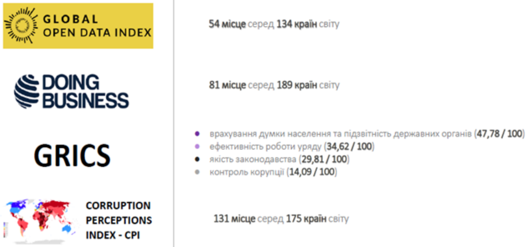
Рис. 3. Позиція України у міжнародних рейтингах

Ці дані щодо ефективності, результативності та якості діяльності органів державної влади, їх підзвітності та прозорості також підтверджуються позицією України у міжнародних рейтингах.