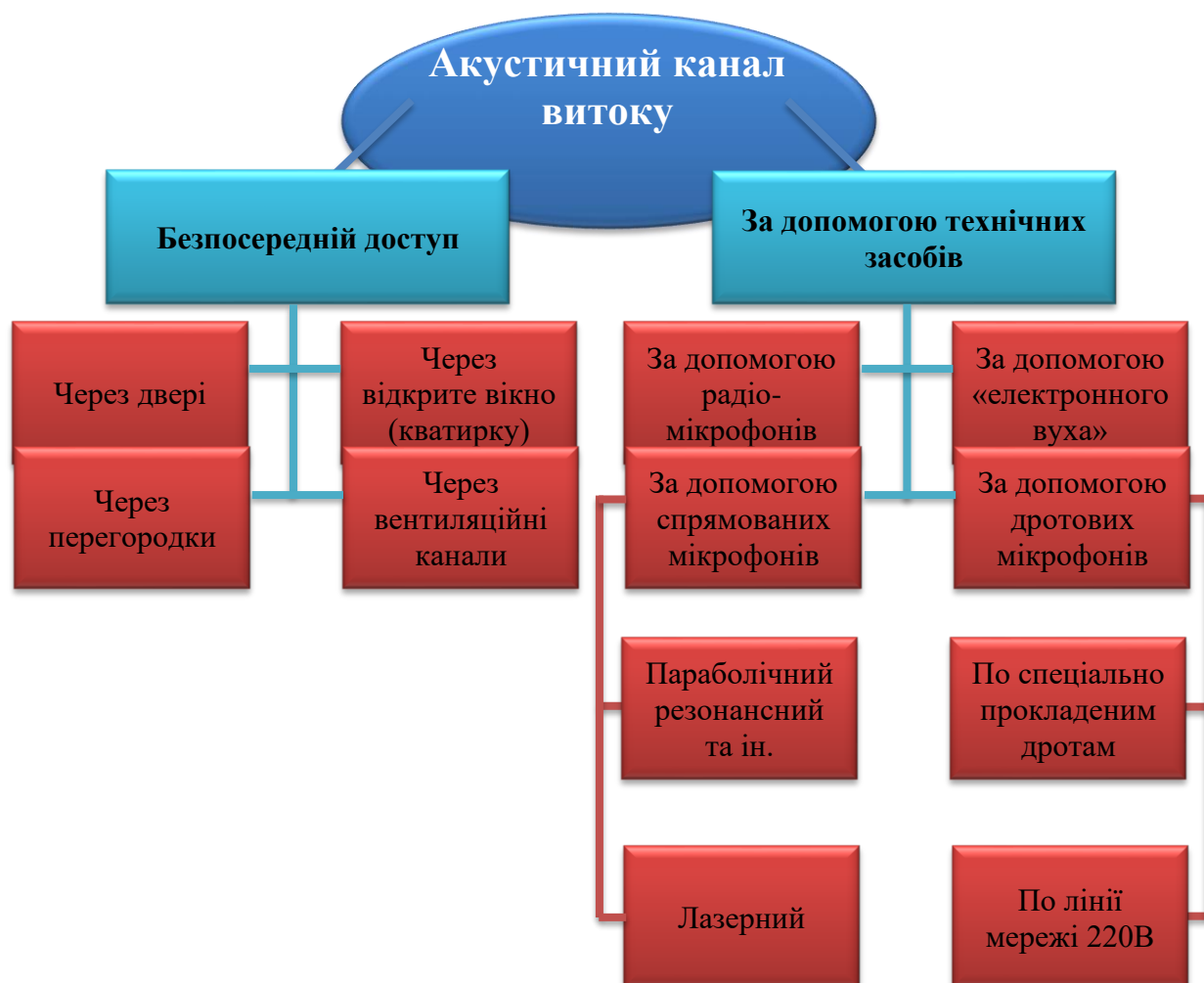
Рисунок 8.3 – Несанкціонований доступ до конфіденційної інформації з акустичного каналу витоку

Несанкціонований доступ до конфіденційної інформації з акустичного каналу витоку (рисунок 8.3.) може здійснюватися: