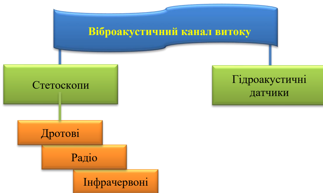
Рисунок 8.4 – Несанкціонований доступ до вмісту переговорів

може бути також здійснений (рисунок 8.4.) за допомогою стетоскопів і гідроакустичних датчиків.