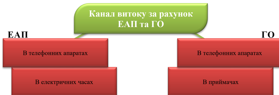
Рисунок 8.5 – Доступ до конфіденційної інформації в залежності від виду каналу витоку

Подібні канали витоку існують при наявності в приміщеннях телефонних апаратів з дисковим номеронабирачем, телевізорів, електричних годин, підключених до системи годинофікації, приймачів і т.д.