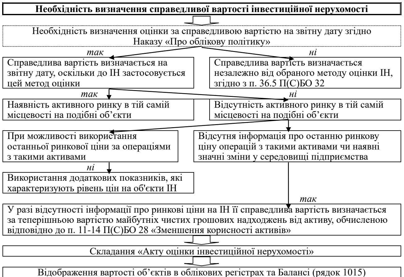
Рис. 1.1. Алгоритм визначення справедливої вартості інвестиційної нерухомості

Приклади правильно оформлених рисунків наведено нижче.