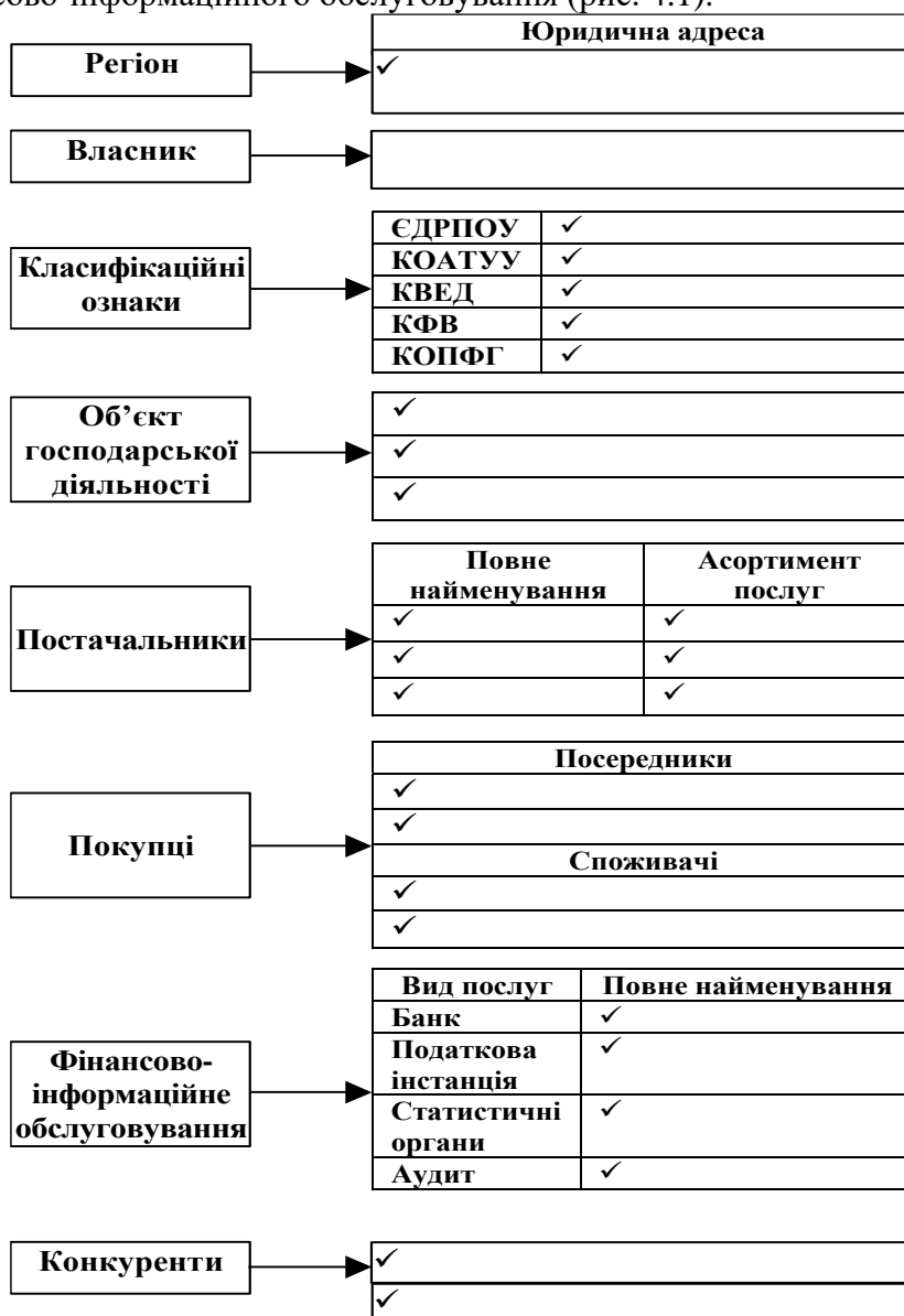
Рис. 4.1. Підприємство та його економічне оточення