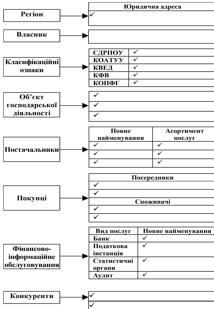
Рис. 4.1. Підприємство та його економічне оточення