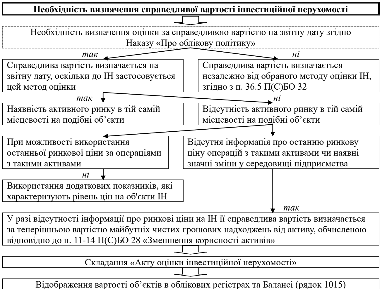
Рис. 1.2. Алгоритм визначення справедливої вартості інвестиційної нерухомості