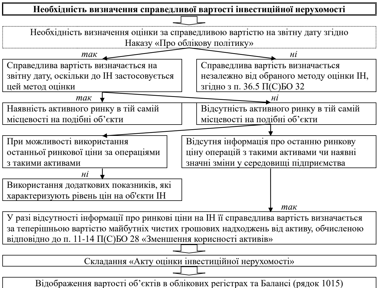
Рис. 1.2. Алгоритм визначення справедливої вартості інвестиційної нерухомості