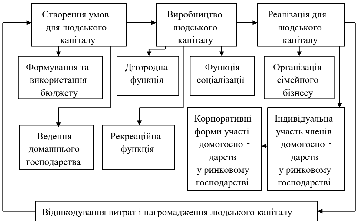
Рис. 2. Діяльність домашнього господарства з формування людського капіталу [7, с. 376]

Діяльність домашнього господарства з формування людського капіталу наведена на рис. 2.