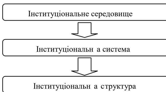
Рис. 2. Супідрядність понять "інституційне середовище", "інституційна система" та "інституційна структура"

Варто повернутись до з'ясування сутності "інституціональної структури". Дійсно, інколи її визначення нагадує традиційне розуміння інституціональної системи або інституціонального середовища. На думку О. Уільямсона, "інституціональна структура – це основні політичні, соціальні й правові норми, що є базою для виробництва, обміну й споживання" [72].