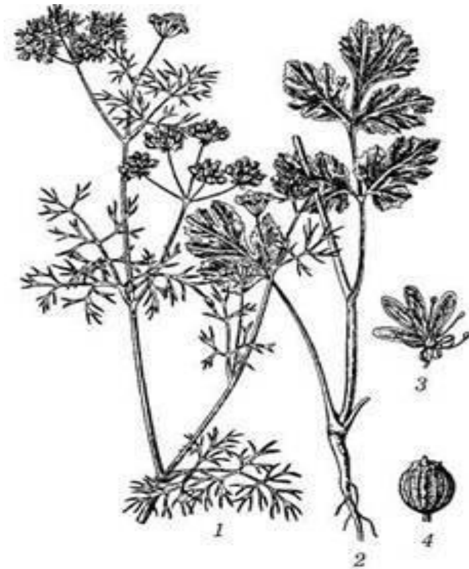
Мал. 2. Коріандр: 1 – верхня частина стебла з квітками і плодами, 2 – прикоренева частина стебла, 3 – квітка, 4 – плід (коробочка)

Прядивні культури. Ці культури також належать до групи рослин технічного використання. Вони забезпечують текстильну промисловість незамінною сировиною — волокном. Міцне, еластичне, стійке проти гниття рослинне волокно широко використовують для виробництва різних тканин побутового й технічного призначення. З нього виготовляють також шпагати, морські канати, рибальські та спортивні сітки, кінську зброю, штучну шкіру, нитки, целулоїд тощо.