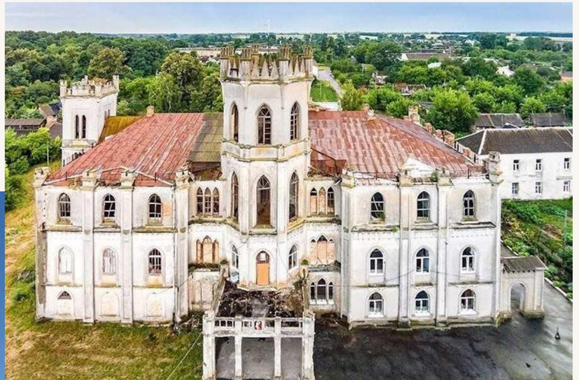
Палац Терещенків. Сучасний вигляд