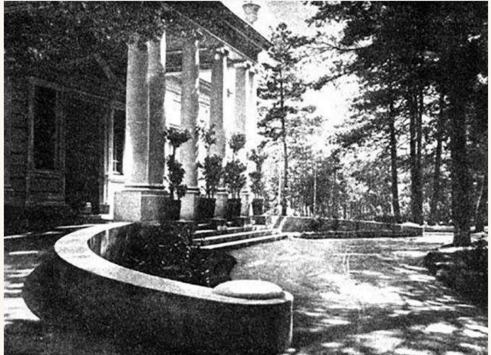
фото не датоване Сер. 1910-х років