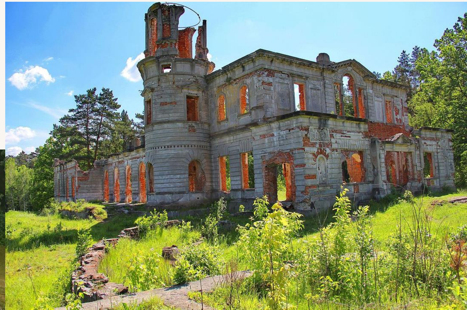
Палац Терещенків. Сучасний вигляд