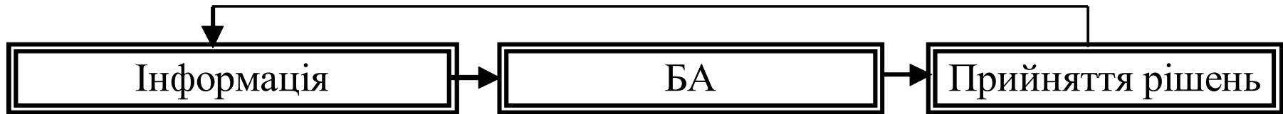
Рис. 4. Місце БА в процесі прийняття управлінських рішень

БА займає проміжне місце, виступаючи зв'язковою ланкою між інформаційним етапом і етапом прийняття рішень, тим самим впливаючи на якість прийнятих управлінських рішень.