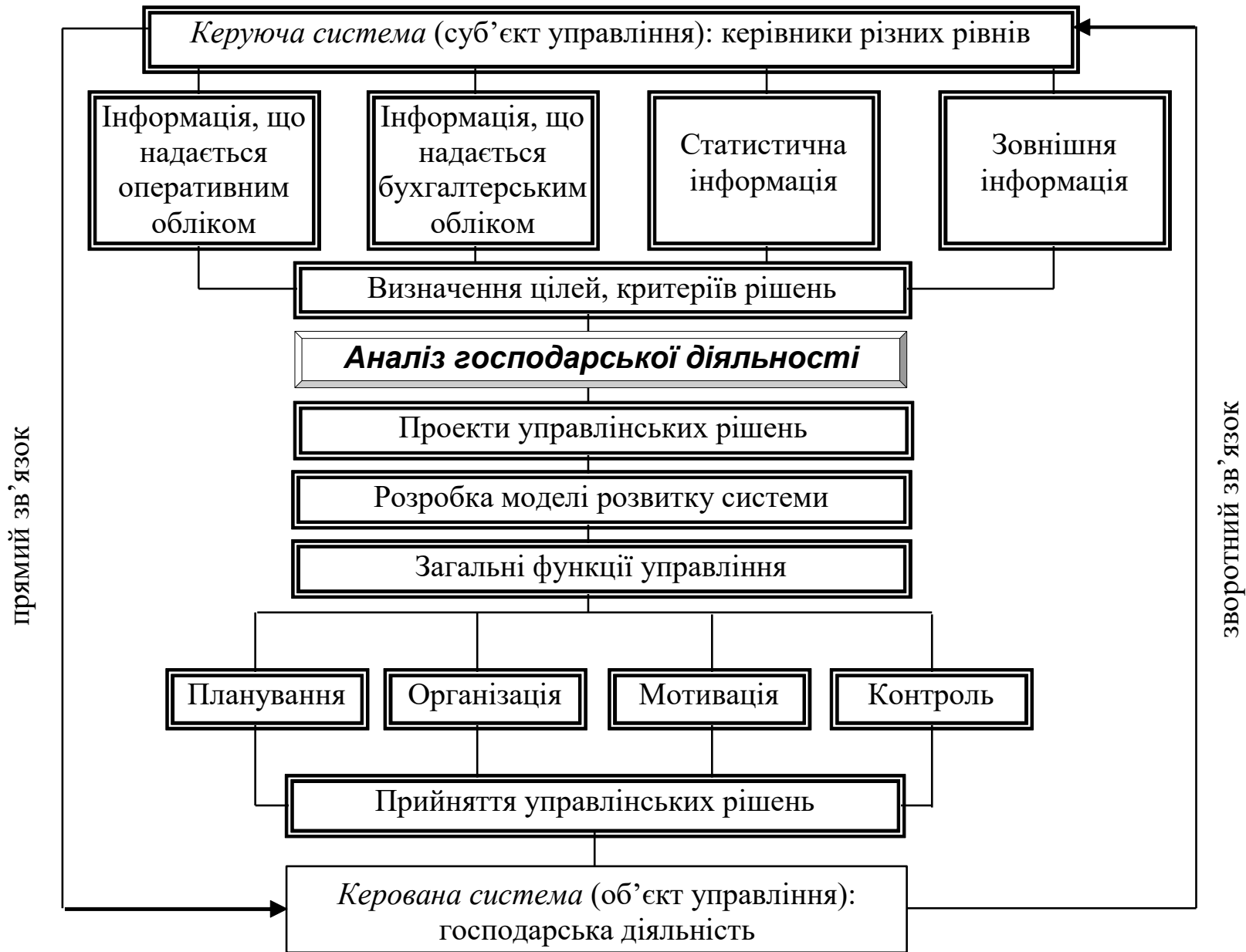
Рис. 3. Місце бізнес-аналізу в управлінні