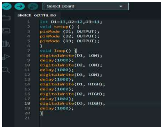
Рисунок 1.4. Скетч для миготіння світлодіода D1D2D3D4D5D6 на Arduino

Висновок: навчилася підключати Arduino Uno до ПК, навчилася підключати зовнішні вимірювальні пристрої до Arduino, навчилася розробляти, завантажувати та налагоджувати програми керування. Вивчила можливості використання платформи Arduino Uno в складі вимірювальних пристроїв.