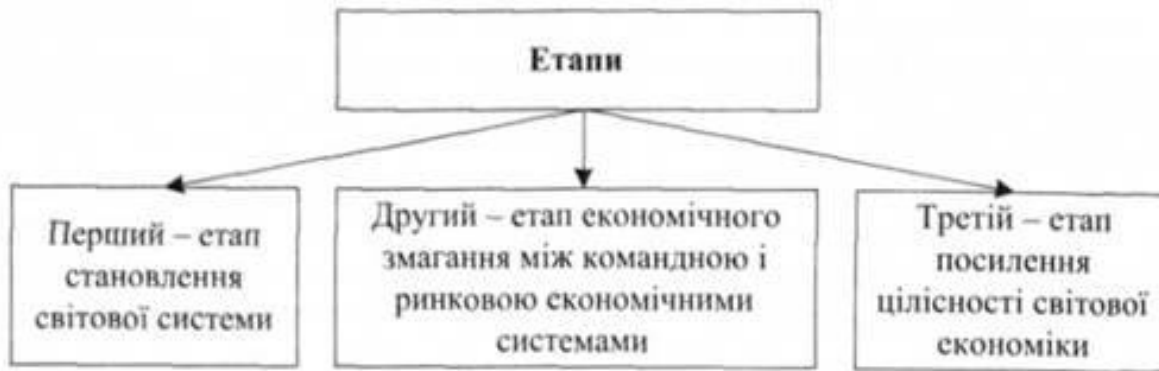
Схема 2.3. Етапи розвитку світового господарства

Складовою світового господарства є також міжнародні економічні організації, серед яких найвідоміші - Міжнародний валютний фонд, Світовий банк, Світова організація торгівлі, Організація Об'єднаних Націй з промислового розвитку (ЮНІДО), Продовольча і сільськогосподарська організація Об'єднаних Націй (ФАО), Між