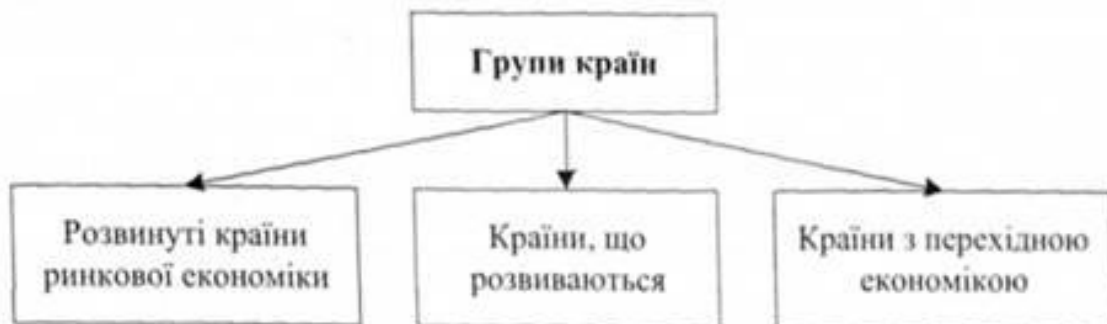
Схема 2.2. Структура світової економіки за рівнем економічного розвитку країни

подарство, перебувають на різних щаблях цивілізації. За рівнем економічного розвитку світова економіка включає три великі групи країн (див. схему 2.2):