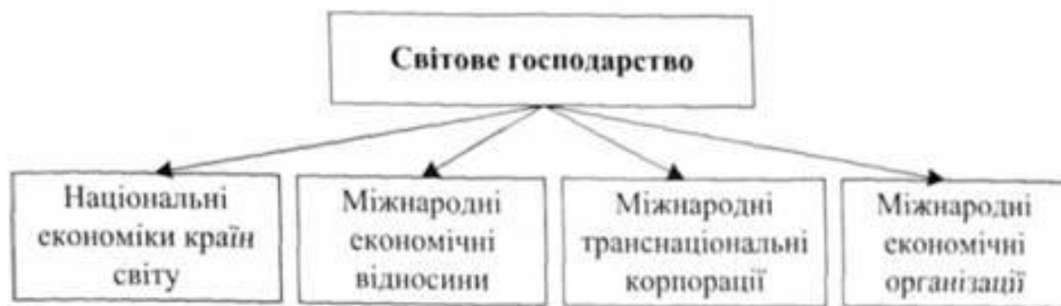
Схема 2.1. Структура світового господарства за елементами

Світове господарство включає національні економіки понад 200 держав світу, що розмежовані майже 260 сухопутними кордонами. Нації і народності, що проживають у цих країнах, розмовляють майже 2800 мовами, а в обігу налічується понад 300 найменувань національних грошей. Національні економіки, що утворюють світове гос-