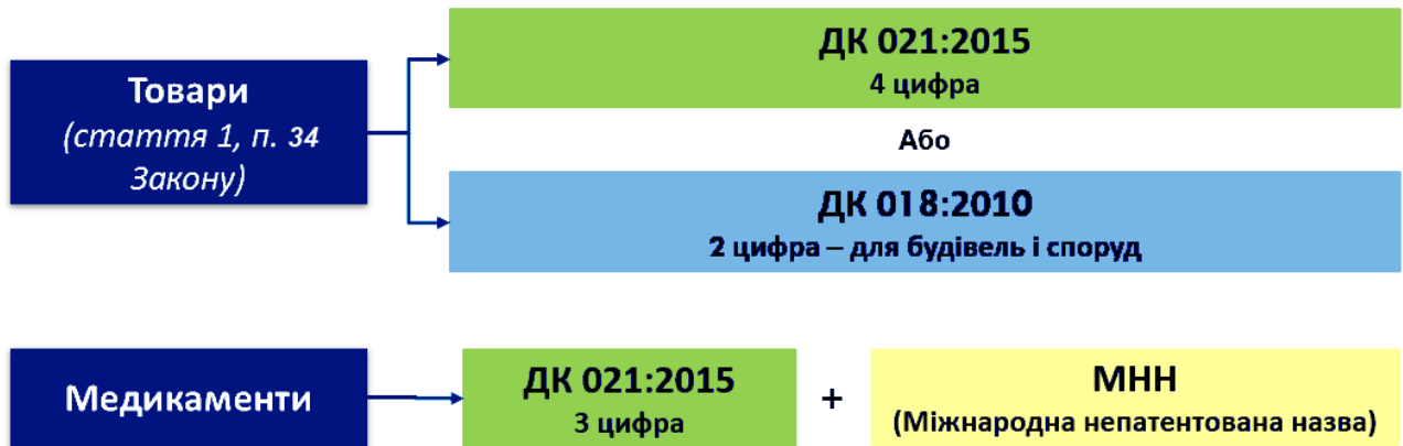
Рис. 3. Класифікатори для визначення предмету закупівлі

Для визначення предмету закупівлі для товарів застосовуються наступні класифікатори: