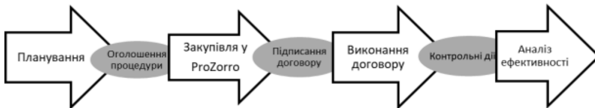
Рис. 1. Процес проведення публічних закупівель в Україні